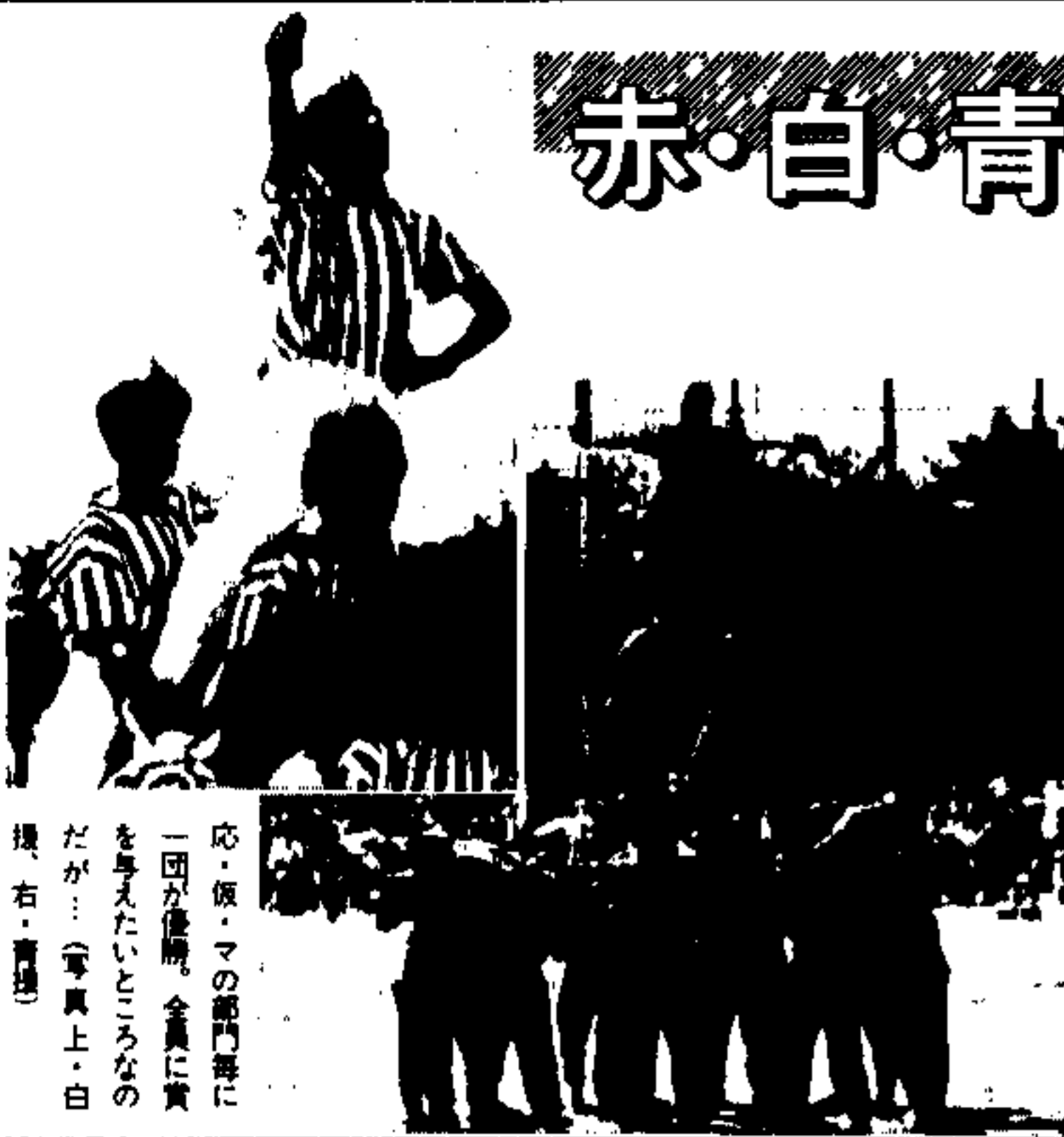
応・飯・マの部門毎に一回が優勝。全員に賞を贈りたいところなのだが…(写真上・白・白、右・青)