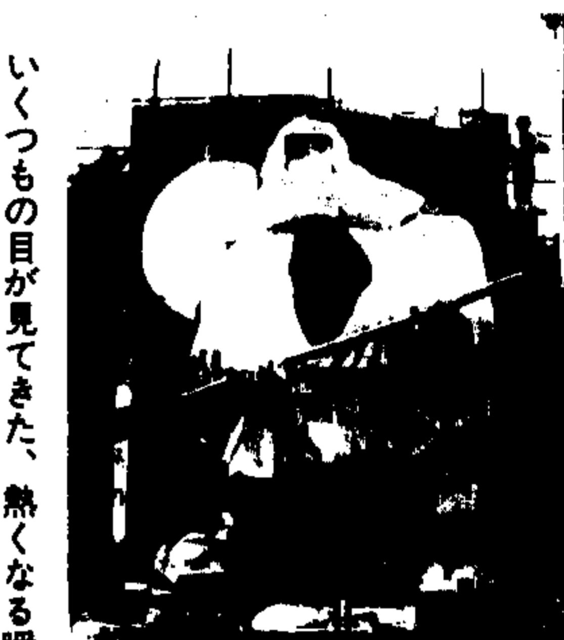
竹カゴの減少、やぐら丸太の老朽化はマスコの抱える問題。仮装はロック音楽にダンスが近年トレンド。時代の流れは体育祭も変える。(写真は上・白・マ、左下・赤・ミニマス、右下・白・飯)